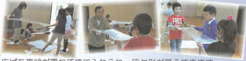
広げた真綿が重ねて袋に入れられ、段々形が見えてきます。